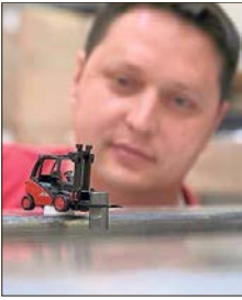
Wenn mit dem Miniaturstapler gearbeitet wird, ist Augenmaß gefragt.