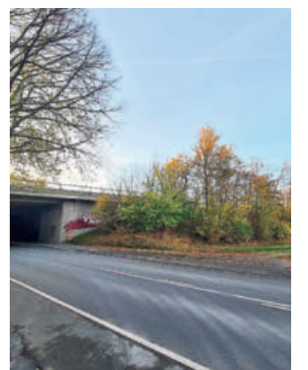
Ohne Autobahnabfahrt geht nichts: Wenn, dann käme sie an der Bielefelder Straße.

„Es ist nicht einfach, Flächen zu finden, die vertraglich entwickelt werden können.“ Und größere Gewerbegebiete ließen sich nur auf interkommunaler Ebene realisieren. Der Beigeordnete Thorsten Herbst sagt: „Nicht alles in dem Plan wird eins zu eins umsetzbar sein.“ Deshalb seien die Gebiete auch nicht „flächenscharf“ eingezeichnet. So habe man bei der späteren Umsetzung dann noch ein klein wenig Spielraum.