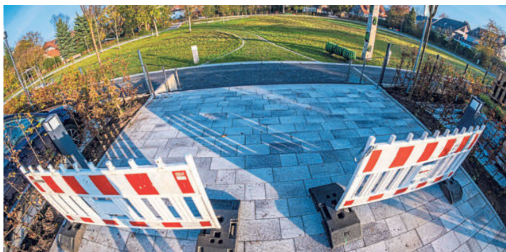
Derzeit ist der Zugang zur Bürmschen Wiese hinter dem Rathaus provisorisch gesichert. Über eine Dauerlösung beraten die Fraktionen nun in ihren Fraktionen.